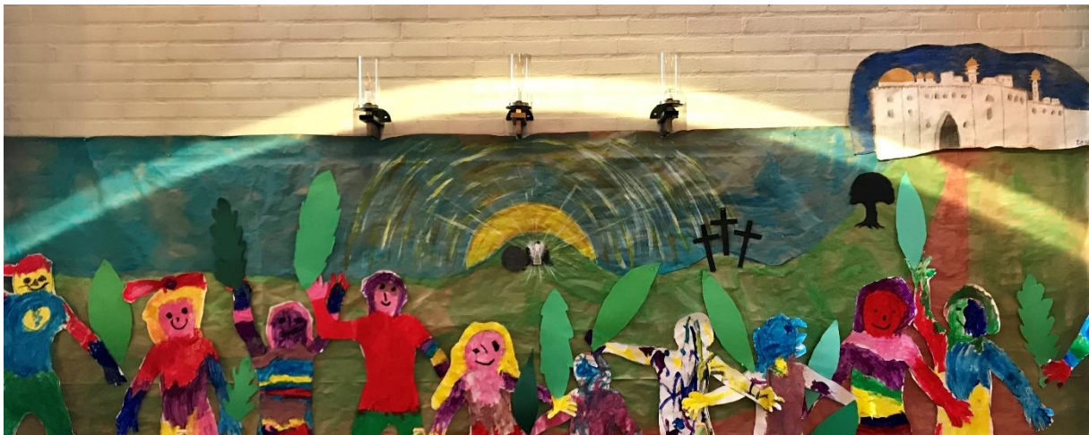
Påskebilde fra bhg 2019